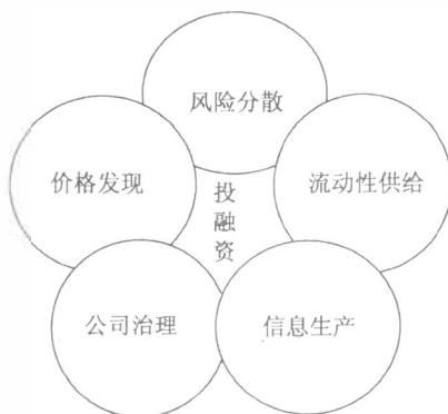
图2 金融体系的基本功能

事实上,上述的观点是建立在以下几个值得进一步讨论的假定条件上:(1)没有交易成本;(2)不存在非确定性;(3)经济主体是理性的;(4)没有信息不对称现象;(5)没有委托和代理人的问题;(6)金融活动中没有外部性问题。但是,我们很难找到这样的完全市场,相反,在市场不完全的条件下,由于存在市场非有效性、价格不确定性、风险规避手段的不完备性、信息不称性和激励机制不相容性等的制约因素,市场机会线有可能“找不到”,于是,国内金融体系中的无论哪一种融资渠道都不能保证资金的有效配置,这意味着企业有可能不在生产可能性曲线上制定生产计划。当然,消费者也就因此无法安排自己最佳的消费(投资)计划。因此,要想克服这些阻碍,正常发挥六大基本功能(参见图2),是决定在上述这些前提条件不再成立时,金融体系能否发挥正常作用的关键所在,从而也被认为是今天衡量一个国家的金融体系能否推动经济持续增长的决定要素。而且,这些基本功能彼此互相关联,只要有一个功能没有正常发挥作用,那么,资金配置渠道就会受阻,金融体系的作用就会被扭曲,抵抗外界冲击的能力就会降低,金融危机的风险就会增大。从这个意义上讲,金融体系的脆弱性就是指金融体系的基本功能无法得到正常发挥的状态。